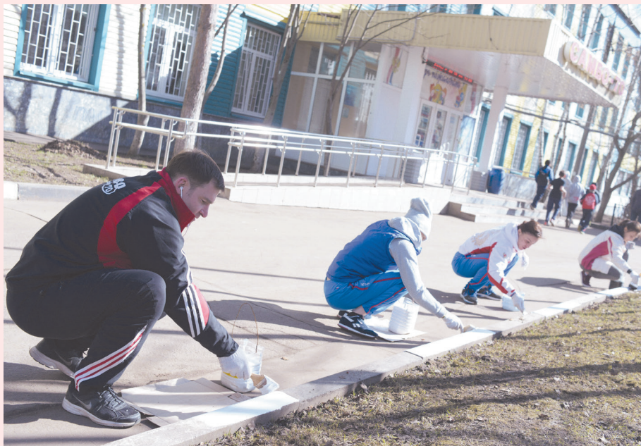
Субботник в школе «Самбо-70»