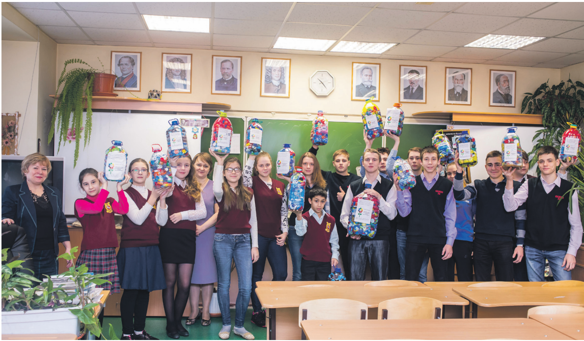
Школьники из «Самбо-70» со своим «уловом»