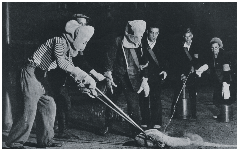
Школьники учат тушить зажигательные бомбы (1941 г.,)