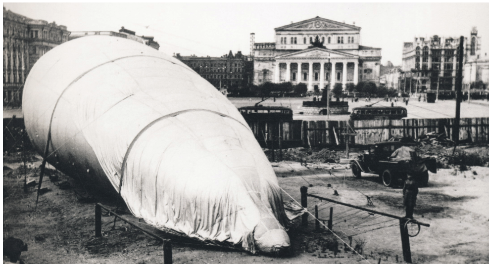
Аэростат на площади Свердлова (1941 г.)