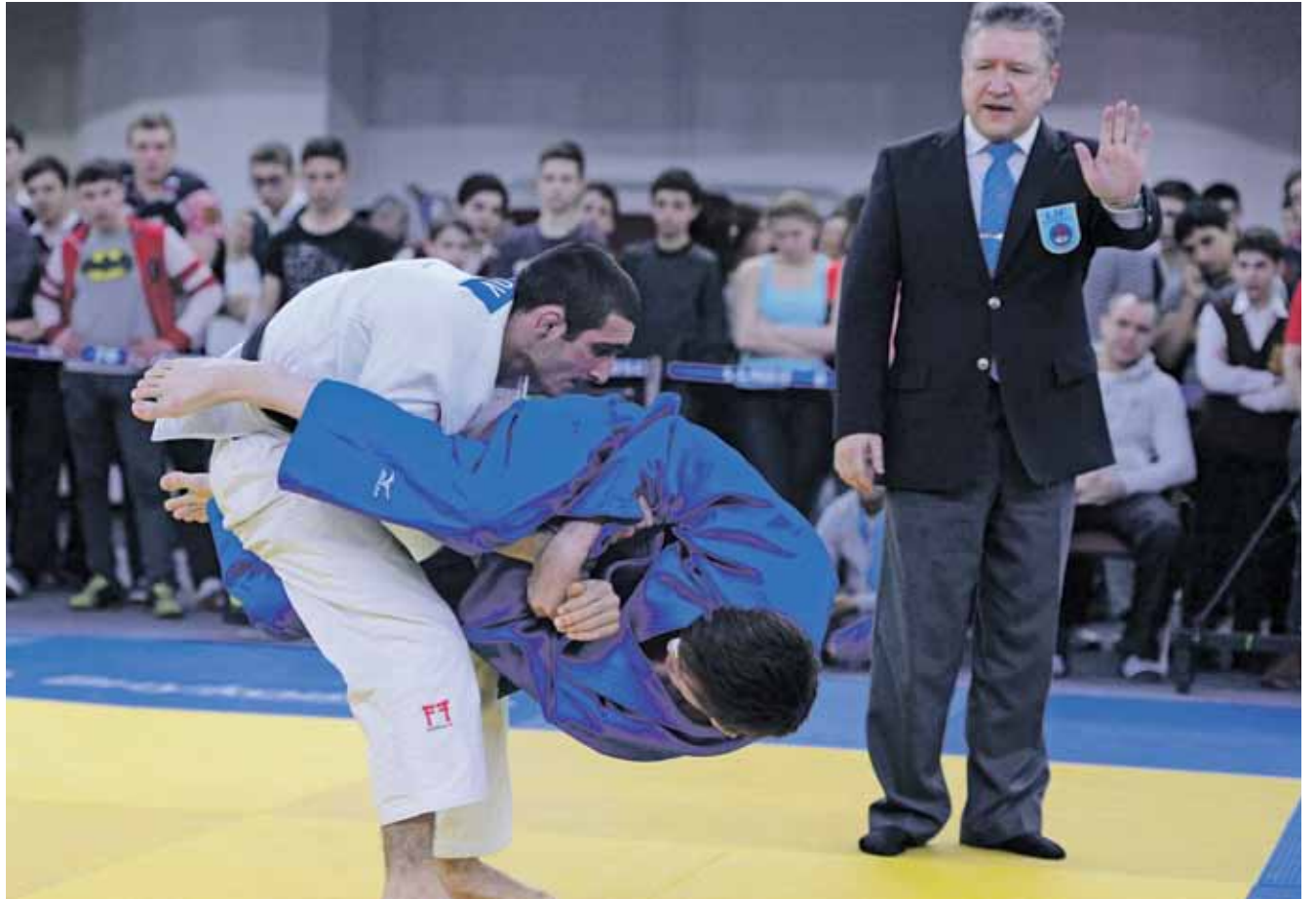
Турнир «Весенние надежды» в «Самбо-70» собрал рекордное количество участников

Все воспитанники «Самбо-70», принявшие участие в турнире благодаря серебряным медалям первенства России, завое-