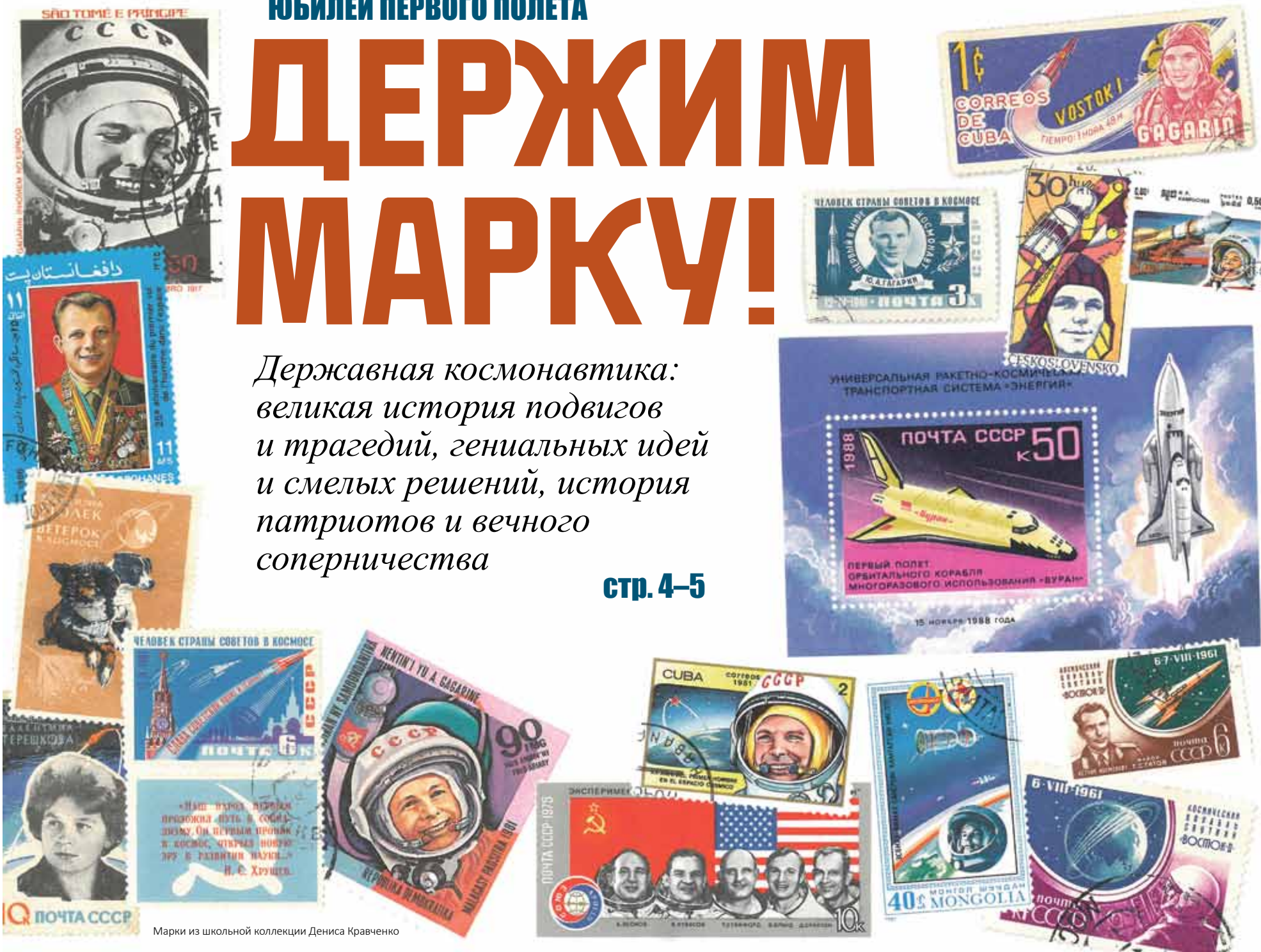
Марки из школьной коллекции Дениса Кравченко