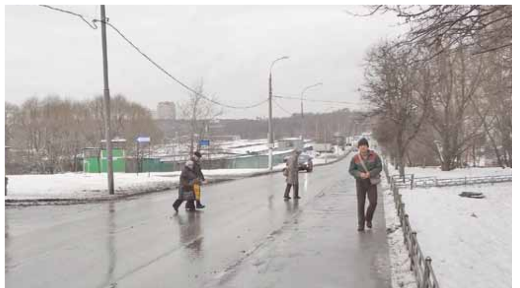
Здесь должен быть переход!