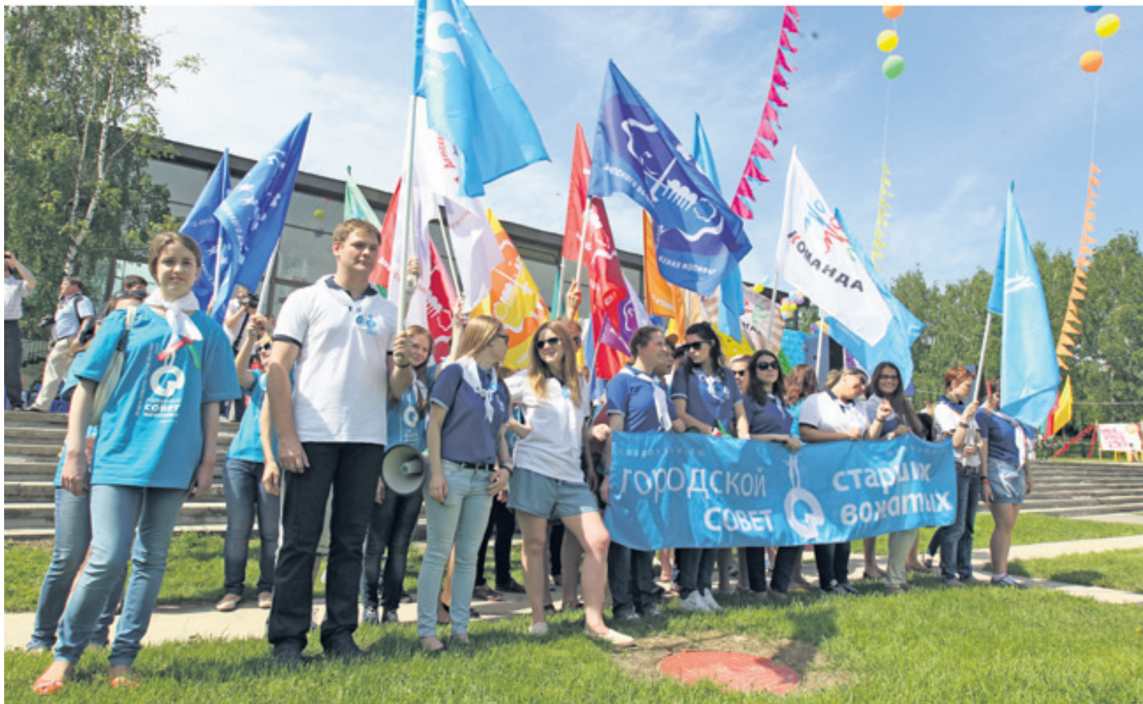
Сегодняшнее детское движение России — яркое и пестрое

«Самбо-70» — это, конечно, не детское движение. Но это большая семья, общество или, как теперь принято говорить, комьюнити. Очень многие приходят на работу к нам, многие продолжают общаться и встречаться после окончания школы. То же самое происходит и в нашей Всероссийской организации «Дети России Образованы и Здоровы» (сокращенно — ДРОЗД). Эта организация существует с 2003 года и имеет свои центры в десятках городов России.