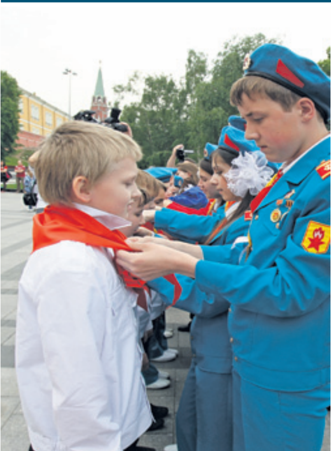
Ежегодно в пионерскую организацию принимаются новые члены. Но теперь пионерия отделена от государства

Четверть века, как не стало Всесоюзной пионерской организации имени В. И. Ленина. Тот, кто сегодня моложе 34–35 лет, никогда не повязывал галстук с тремя алыми языками. Есть, конечно, исключения – пионерия-то существует, но совсем не в прежних масштабах.