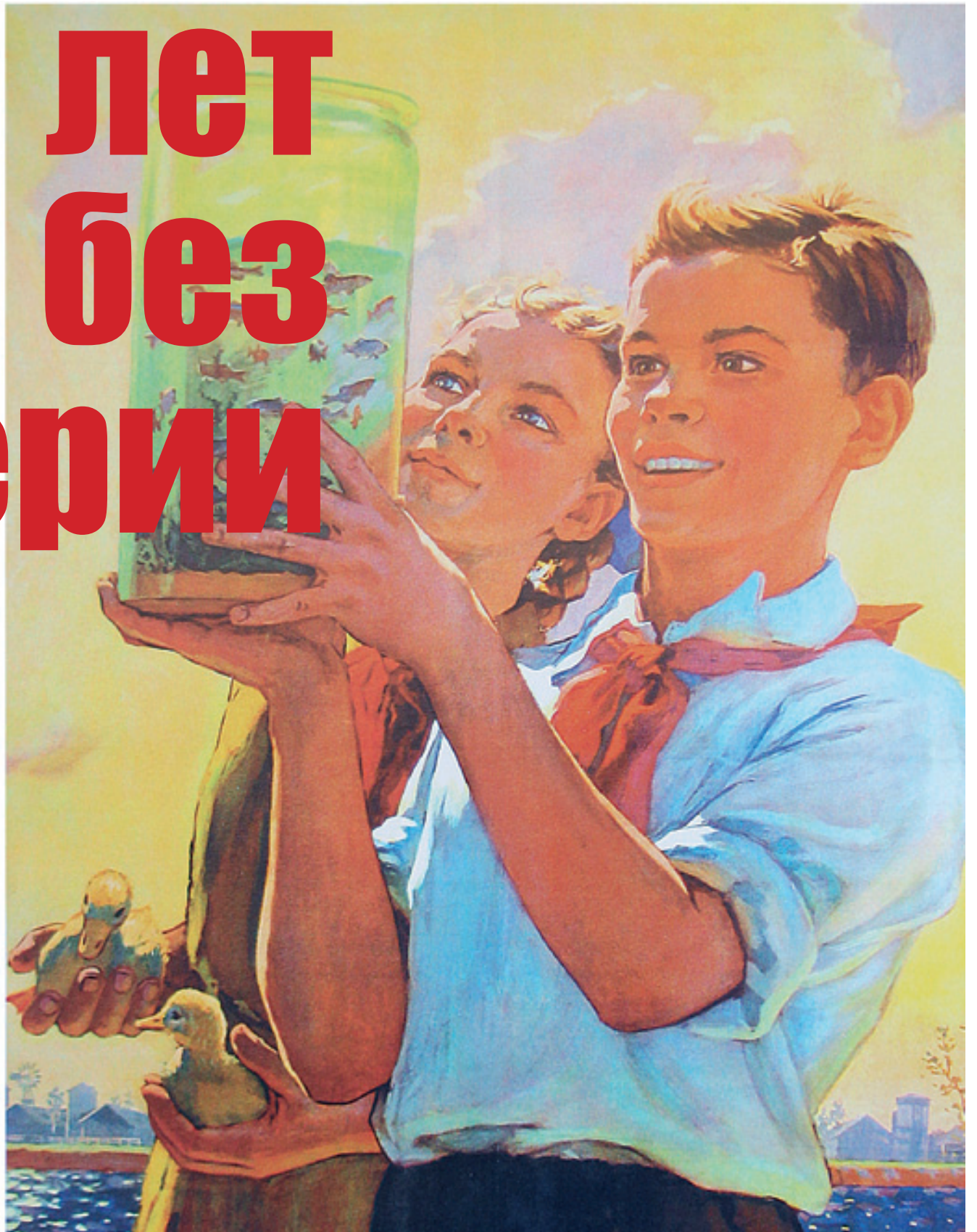
Плакат 1956 года «Оживим пруды и водоемы!». Художник В. Нарышкин

Посетителям Хованского кладбища угрожают