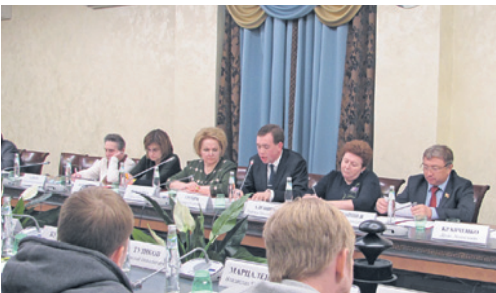
Круглый стол в Общественной палате России, посвященный детскому движению, состоялся именно 19 мая – в день рождения пионерской организации

Становясь учеником «Самбо-70», все годы ребята приносили клятву на верность школе, городу и стране. У нас есть герб и гимн, в котором звучат слова, подчеркивающие наше демократическое устройство: «республика в Теплом Стане». Огромное значение придается обще-школьным мероприятиям и гражданско-патриотическому воспитанию.