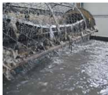
Мойка пластиковых хлопьев

Сам процесс переработки выглядит так. На первом этапе кипы пластиковых пакетов – исходного сырья – распаковывают и укладывают на конвейерную ленту, которая доставляет их в отсек резки. Затем все еще загрязненные полиэтиленовые хлопья попадают в мойку, где несколько валиков последовательно очищают их от мусора и «отстирывают».