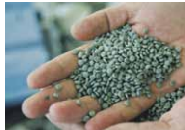
Вторичная гранула, ее покупают как сырье производителю пластиковых изделий

Вторичная гранула – конечный продукт предприятия по переработке пластика. Его покупатели – заводы-изготовители полимерных изделий. Использование вторичной гранулы снижает себестоимость продукции без потери качества. Она настолько востребована, что при имеющихся собственных мощностях по переработке на рынке присутствует импортная вторичная гранула.