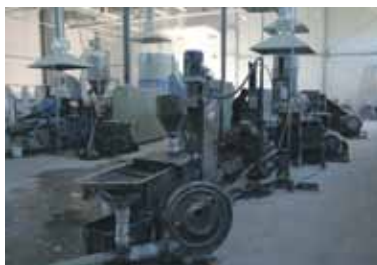
Фрагмент производственной линии по переработке пленки во вторичную гранулу

В грануляторе полимер расплавляется и под давлением выдувается из отверстий. Из них выходит пластиковая «лапша», которую режут на гранулы и охлаждают в воде. Гранулами заполняют мешки объемом 2 куб. метра. Полный мешок весит 1 тонну. Мешки перевозят в место хранения готовой про-