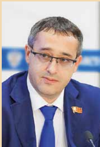
Председатель Московской городской думы Алексей Шапошников

С Днем Победы, дорогие москвичи! Желаю всем нам мира и согласия!