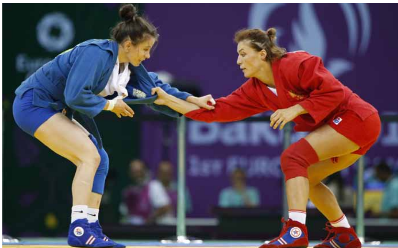
Яна Костенко (справа) выиграла первые в истории Европейские Олимпийские игры